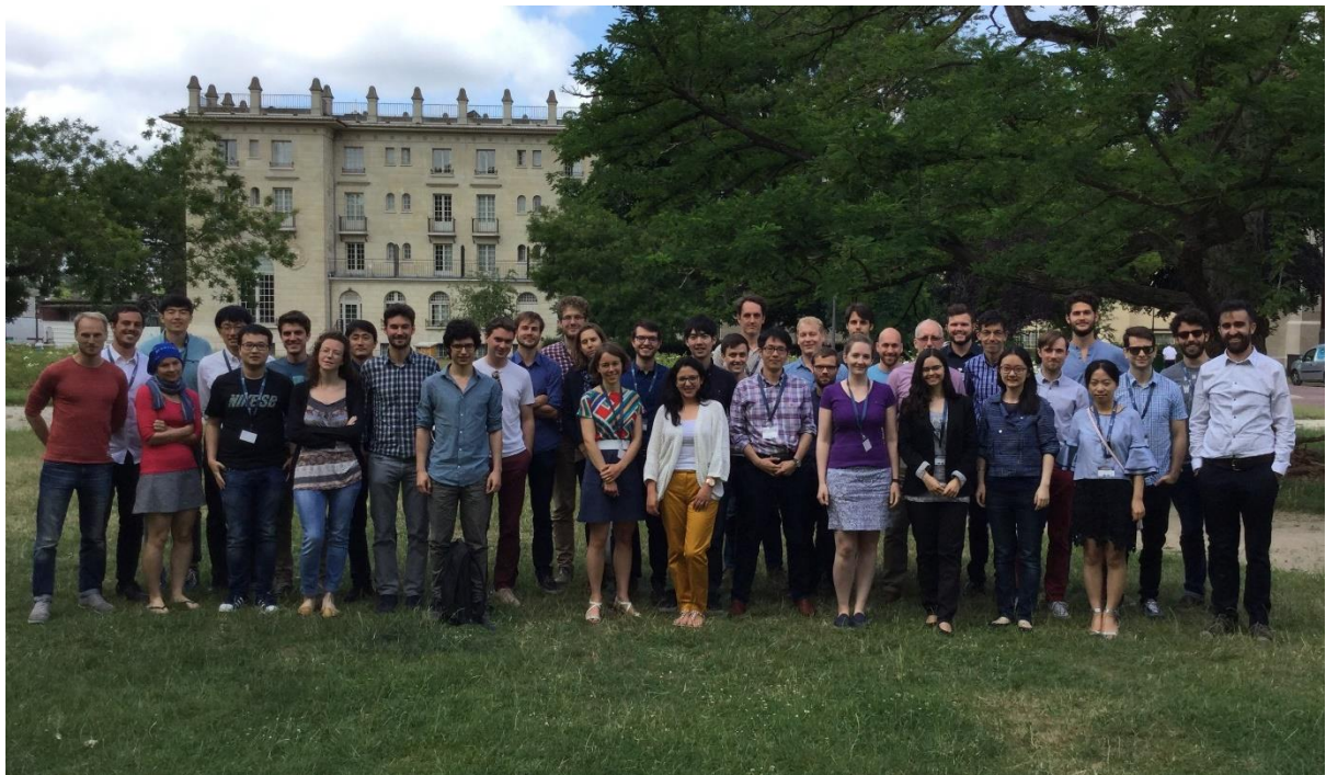
サマースクールの集合写真@パリ(筆者は前列中央右)

ロンドンでの二年目も終わり、ようやく研究がメインの段階に移行しつつある夏ですが、この環境をより活かして楽しめるよう益々精進していきたいと思っています。