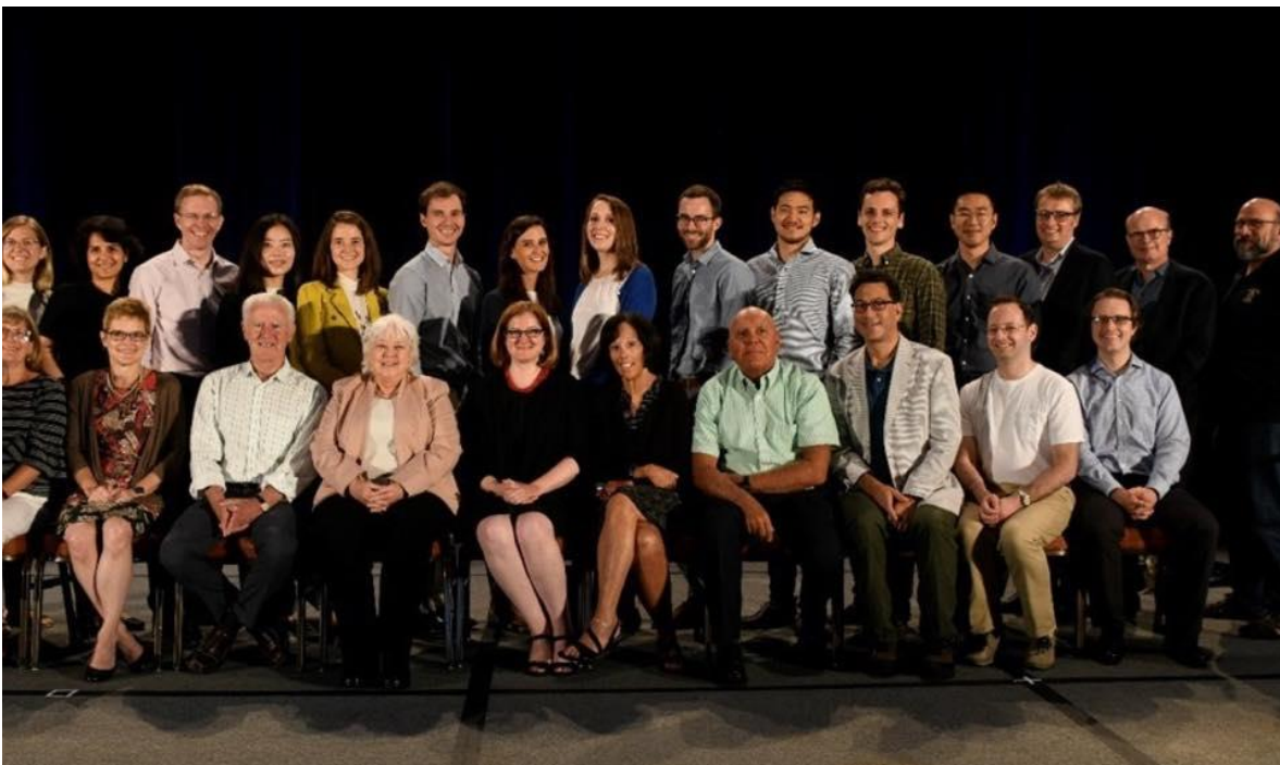
私の“アカデミック家族”写真: 同系譜の歴代研究者達と学会時に記念写真

HBSでのコースはこれまでお世話になってきた助教授が責任者として教鞭を執ったので、私は各教材や資料作成等に従事した。ほぼ毎回クラス前後、授業計画設計についてや授業反省等を議論した。授業中も進捗状況や計画に修正が必要な部分などを軽く相談しあった。全体的に、HBSでの経験はこれから経営大学院でMBA生を教える上で重要な考え方等を学ぶ最適な経験だったのではないかと思う。細かい教義のテクニックや生徒の心を掴む小技など、非常に学びが多かった。