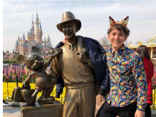
Fig.2 今さら中国行きました！@上海