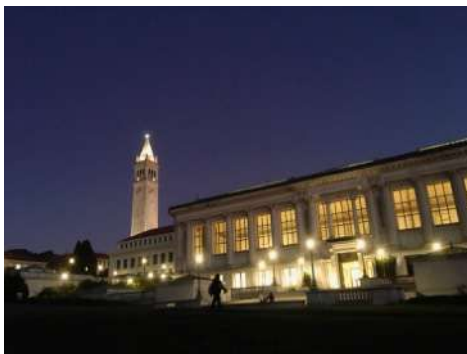
9月、夜7時の時計台 Sather タワー と Doe 図書館