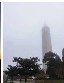
11月の朝9時、 濃い霧に覆われた Sather タワー