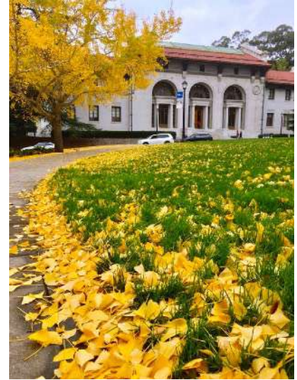
12月、芝生の上に落ちた銀杏

私は統計手法を用いて、自然災害の被災状況を迅速に把握し復興策を提案する研究や、人間活動が大気・植生・水環境に与える影響を調べ改善案を提案する研究を考えています。そのカギとなる空間因果推論で新しい手法を模索しています。