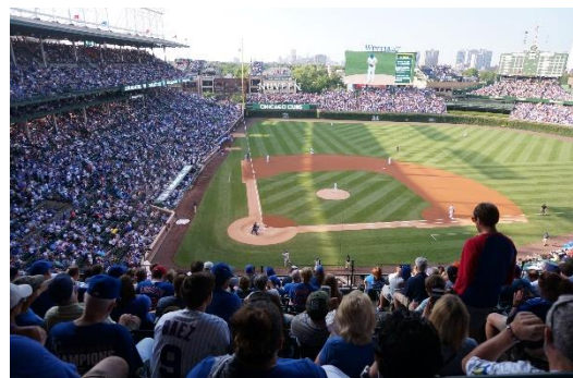
図 2 カブスにダルビッシュ投手がやってきました!野球好きのぼくとしては今年一うれしかったです。卒業までに何とかもう一度 WS で優勝してほしい!

各学期には Speaking, writing, reading といった目標に合わせて授業を無料で取ることができます。もちろん先生は Native で、基本は言語学選考の大学院生たちが授業を行ってくれるのでためにはなります。しかし、上記のテストに落ちて強制となるとさすがに毎週行くのがだるいし、特に一年目は学科の宿題やりたいのに英語のクラスがあってイライラすることもありました。一通りの発音とか、アメリカ来たばかりのときに英語 (文化) に関する疑問なんかを解消するにはいいですが、基本緩いクラスなので、自分からはもう取らないかなあ。英語クラスでよくあるのは中国語で喋っている中国人生徒同士が先生に怒られている光景。